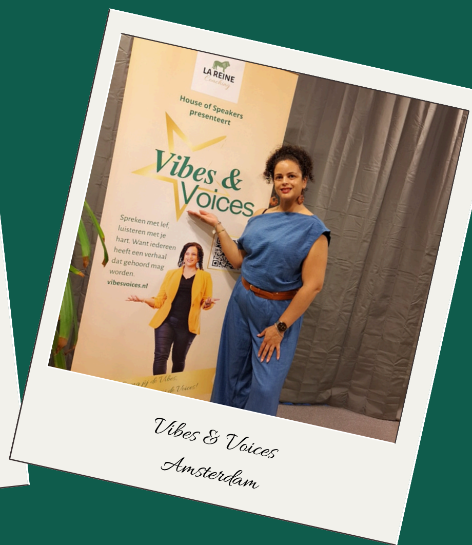
Vibes & Voices Amsterdam