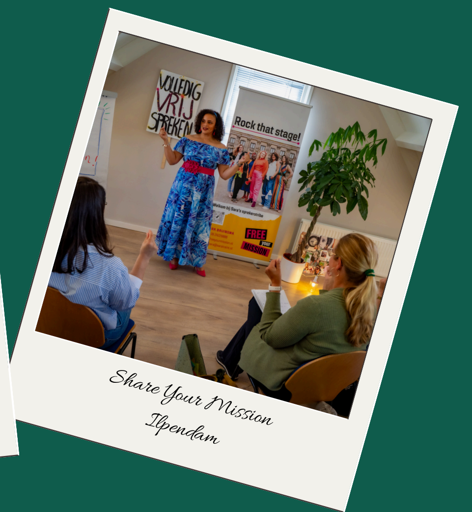
Share Your Mission Ijpendam